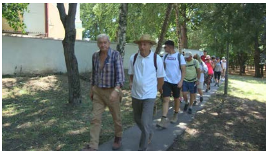
Púte do Nitry sa zúčastnilo viac ako tridsať pútnikov.

Medzi tradičné festivalové podujatia patrí Pešia púť do Nitry . Viac ako 30 pútnikov odchádzalo z nádvorja Kostola sv. Klimenta v Močenku v stredu 20.7. o 14.30. Po absolvovaní 20 kilometrovej trasy sa