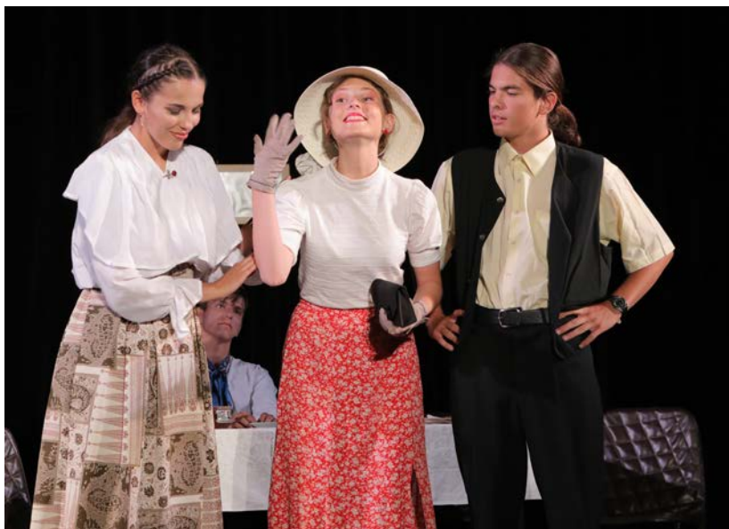
Náš pán minister.

Úvodný deň prehliadok súťažných divadelných inscenácií uzatvárala o 20.30 hra Náš pán minister v podaní divadelného súboru Za Rohom z Prešova . Mládežnícky ochotníci vniesli na javisko dávku situačného humoru a nastolili otázky týkajúce sa fungovania ľudskej spoločnosti, sociálnej integrity či medziludských vzťahov. To všetko bolo vykreslené pomocou groteskných situácií vznikajúcich v 20. rokoch 20. storočia na slovenskej dedine, kde rodina Slaninovcov poslala svoju dcéru Milku na učenie do Švajčiarska, aby nadobudla spôsoby dám a mohla sa tak dobre vydať. Hra poukazuje na odvrátenú tvár vysokej spoločnosti a rovnako aj na rozpor medzi skutočnou láskou a hodnotou peňazí.