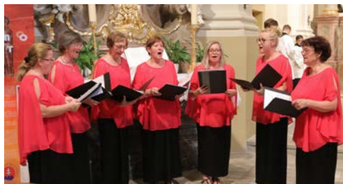
Ženský spevácky zbor Cantica