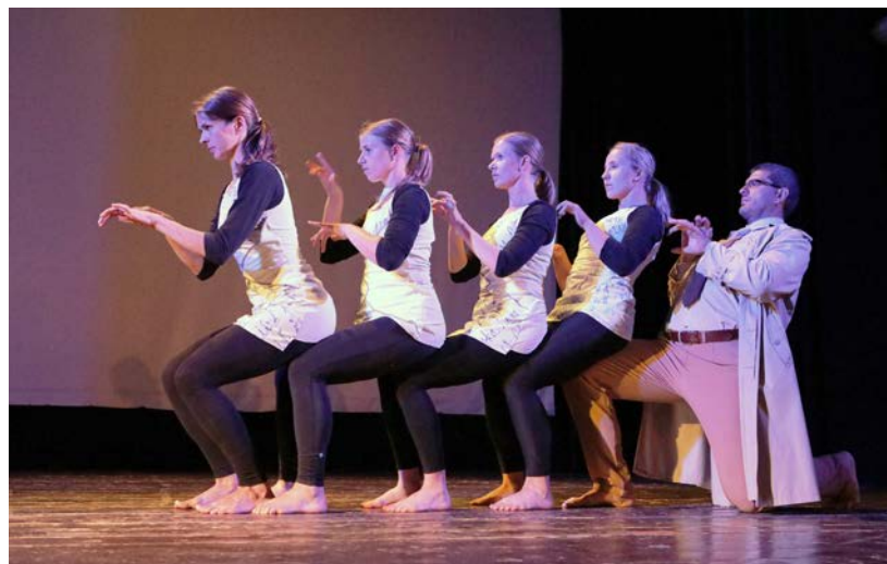
Tanečné divadlo ATak.