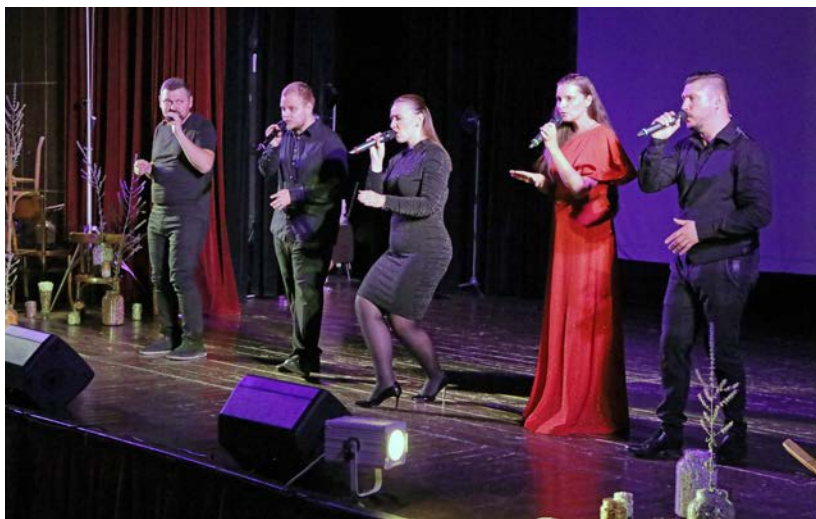
For You Acapella.

tajoval dych a srdečné prania budú hriať ducha a dodávať síl ešte