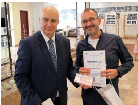
Vítanie hostí a rozdávanie pamätných listov.