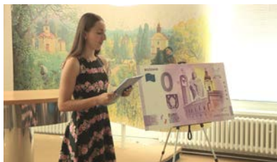
Uvedenie „0“ eurovej bankovky.