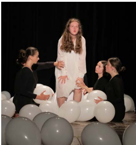
Dievča z morského dna.